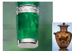
トスカーナのイタリア先住民であるエトルリアの花瓶の模様（復活の印）