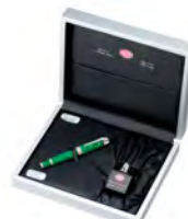
ミニチュアボトルインク付特製ギフトボックス

【製品仕様】 素材：レジン/ソリッドシルバー・トリミング ペン先：18Kロジウム仕上げ(F・M・B) リザーブタンク付ピストン吸入式 シリアルナンバー入 ミニチュアボトルインク付 サイズ：収納時：約130mm(筆記時：約153mm) 直径(最大径)：約13mm 重量：約39g